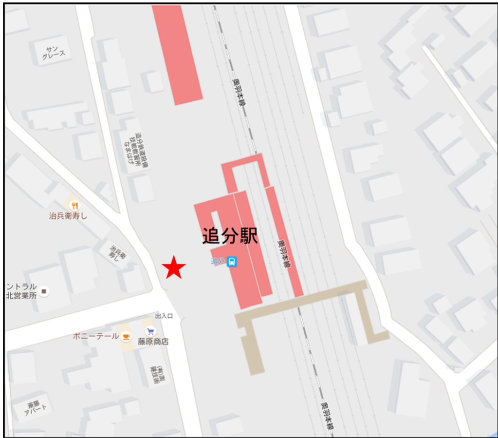
図 2 追分駅バス発着場（星印）